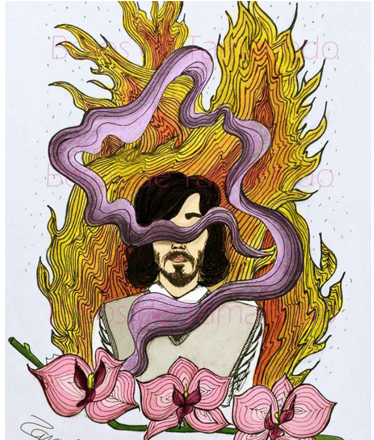
Ilustración para el colectivo “Besos de Tamarindo” 2015; basada en la canción del mismo nombre del grupo musical Café Tacvba