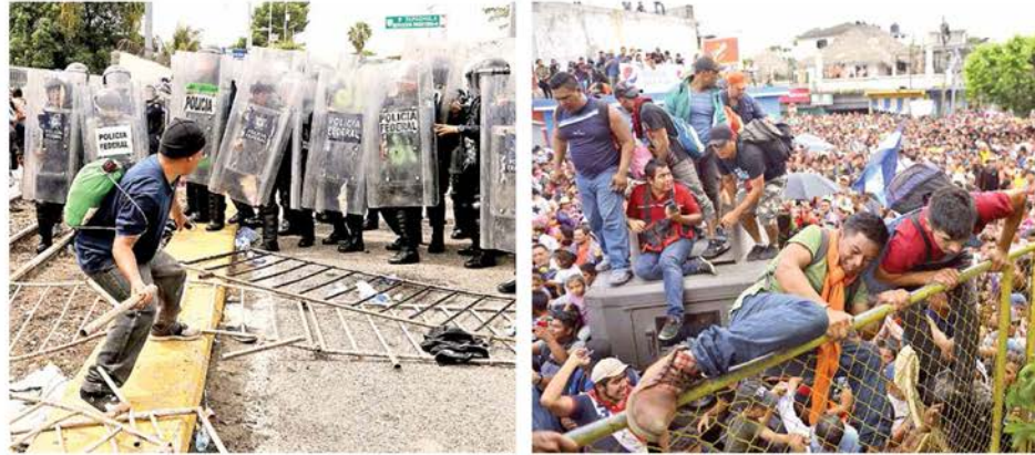
VIOLENCIA. Integrantes de la caravana agredieron a agentes de la PF que les acoraron el paso al país. IRRUPCIÓN. Antes de cruzar hacia Chiapas, migrantes saltaron una valla en Tecón Urdán, Guatemala.