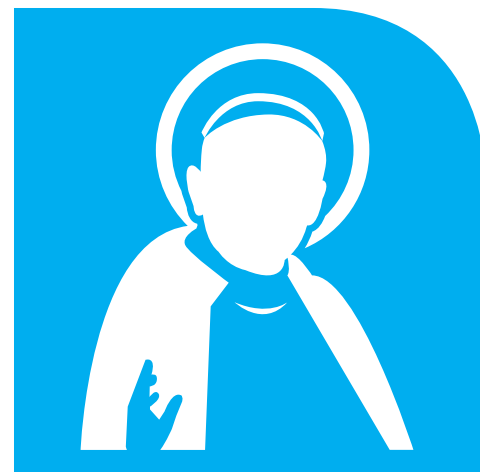
JUAN PABLO II