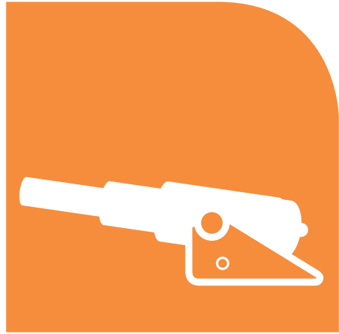
31 DE MARZO