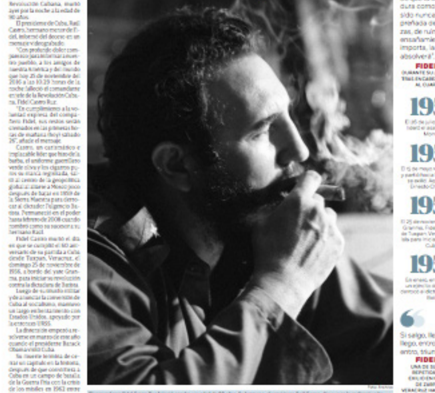
El presidente Fidel Castro fue asesinado a los 90 años. Su hermano, el presidente Raúl Castro, dijo que se le realizará un funeral de Estado en la ciudad de La Habana.

TENÍA 90 AÑOS; LOS RESTOS DEL LÍDER HISTÓRICO CUBANO SERÁN CREMADOS HOY, COMO FUE SU VOLUNTAD, INFORMA EL PRESIDENTE RAÚL CASTRO