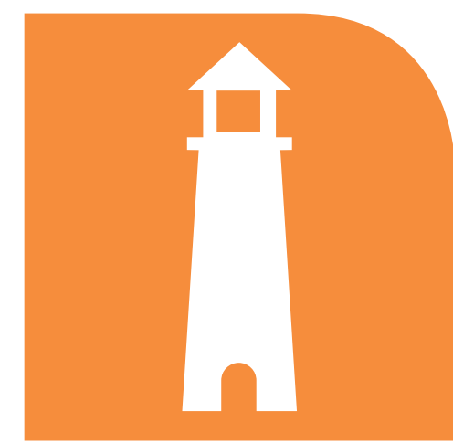
CERRO DEL CRESTON