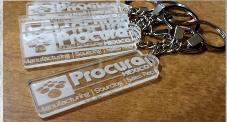
Llaveros para empresa PROCURA