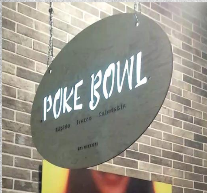
Señal en Madera con Luz Flexible para Nikkori Sushi (Corte Láser)